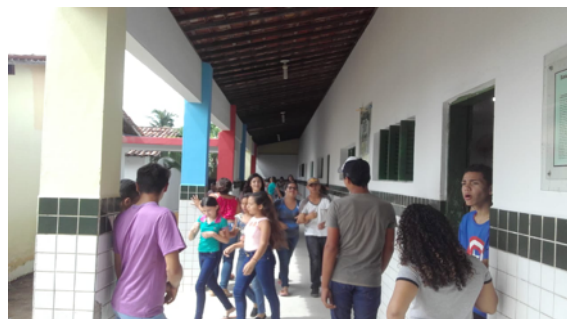
Alunos nas dependências da E. E. E. F. Rodrigues de Carvalho. Fonte: Acervo da Pesquisadora. 2018.

materiais e de educação básica familiar. Percebeu-se que até o ano de 2017 aproximadamente 75% da comunidade escolar é beneficiária do Programa Bolsa Família, que é o único tipo de programa presente na Instituição que atende as necessidades essenciais de sobrevivência da população de baixa renda. O Programa gera grande debate, pois condiciona o benefício à frequência. Alguns alunos frequentam a Instituição de Ensino com intuito apenas de assegurar o benefício, permanecendo nas dependências da Escola, porém, sem interesse na assimilação dos conteúdos programáticos.