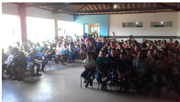
Alunos em atividade extra-classe. Fonte: Acervo da Pesquisadora. 2018.

Mudanças na condição de vida dos sujeitos incluídos no Programa também foram constatadas e leva o corpo docente refletir sobre elas, pois são de caráter meramente financeiro, ou seja, o valor recebido é